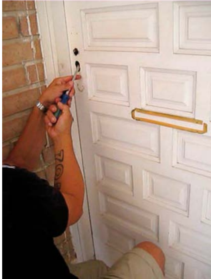
Intervención #1. España, 2012. Constructor desahuciado quitando una puerta de una vivienda propiedad de una caja de ahorros rescatada con dinero público.